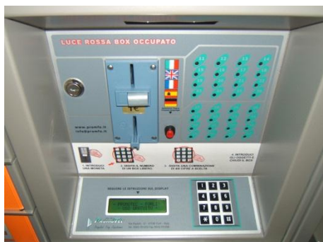
Styringsenhed Integrato (intern) Her vist med møntindkast