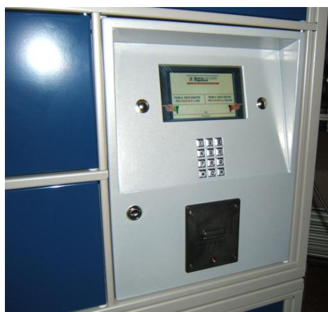
Styringsenhed Touch-35/Touch-100 og RFID-læser