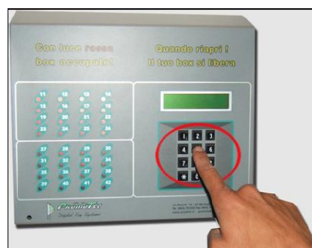
Styringsenhed T-16 / T-32 Her vist uden adgangstegn eller RFID