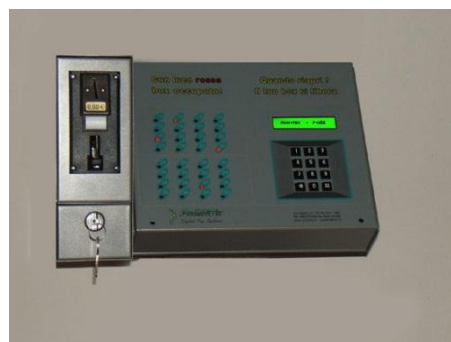
Styringsenhed T-16 & T-32 (ekstern) Her vist med møntindkast